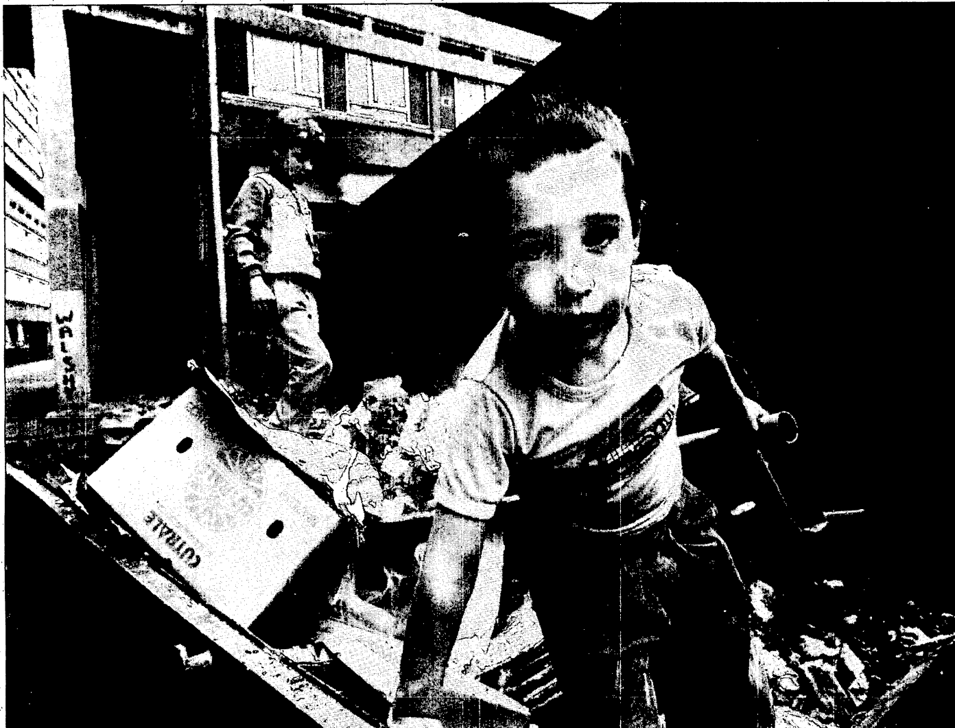
Donna DeCesare, Impact Visuals