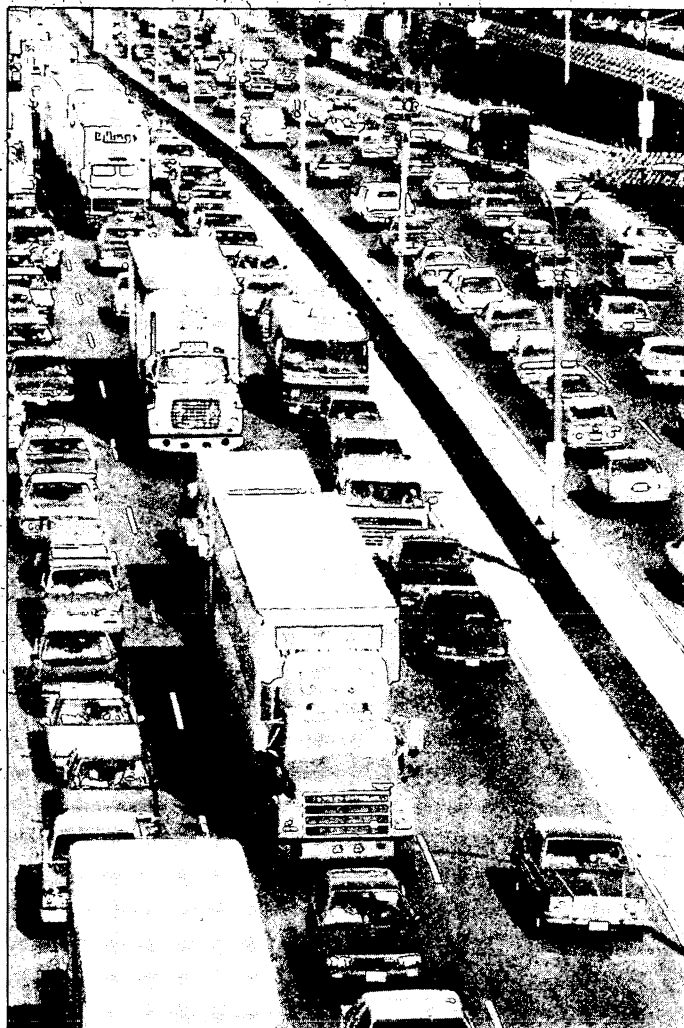
H.L. Delgado, Impact Visuals